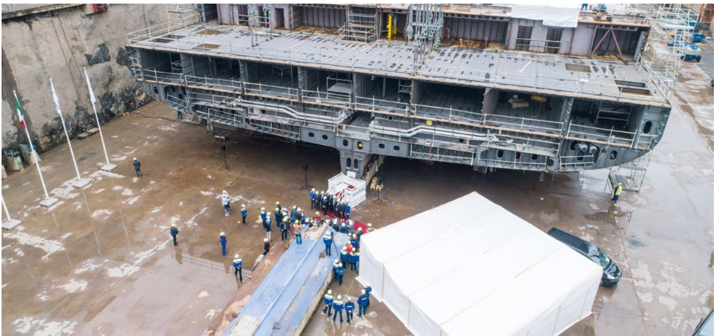
Im Unterschied zu dem überdachten Dock in Papenburg werden die Kreuzfahrtschiffe in den offenen Docks in Turku in voller Länge vom Tank- bis zum Aussichtsdeck aufgebaut

Gegenwärtig sind bereits über 90 Prozent der Modelle konvertiert und werden für das Basic-Design in Turku und die Vorbereitung der Klassifikation genutzt, wie Mäkinen betont. Er schätzt, dass 40 bis 50 Prozent der konvertierten Daten so wieder verwendet werden können, wie sie sind. Darüber hinaus nutzen die Finnen Daten aus Papenburg bei der Entwicklung von Bereichen, die spezifisch für ihre Schiffe sind, als Referenz, sodass die nicht komplett neu entwickelt werden müssen. Die Wiederverwendung bedeutet Zeiteinsparungen von mehreren Monaten für jedes Modul.